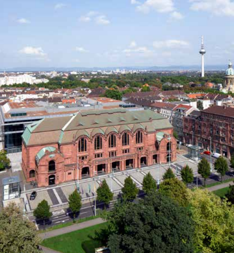
CC Rosengarten, Mannheim